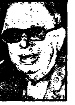
جان بول سارتر

والى قمة مجده وصل جان بول سارتر في روايته البوتي بدون تيوبو» التي صدرت في عام 1947، وفيها وصف بالوان صارخة لعداب افراد منظمات المقاومة المرسية المستترين تحت ظل حكام نيشي الفاشيين.. ومن اثاره الادبية «يوم مخرب»، وهي مسرحية ابطالها ثلاثة رجال ضيقا القوس يفيو الكلام سيلو الاعمال، ولكنهم مخلصون لاهية الحياة وحقيقتها. ورغم طول هذه الرواية وبذاتة اشخاصها وعدم تكامل عناصرها الفنية الادبية فان التقاد قد وجدوا فيها رواية ذات اهمية ولغة وطلاوة.